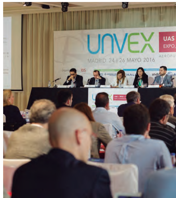
Sala de conferencias del palacio de exposiciones de

La feria Unvex reúne en León a más de 500 expertos y 60 empresas especializadas en los Sistemas Aéreos Remotamente Tripulados