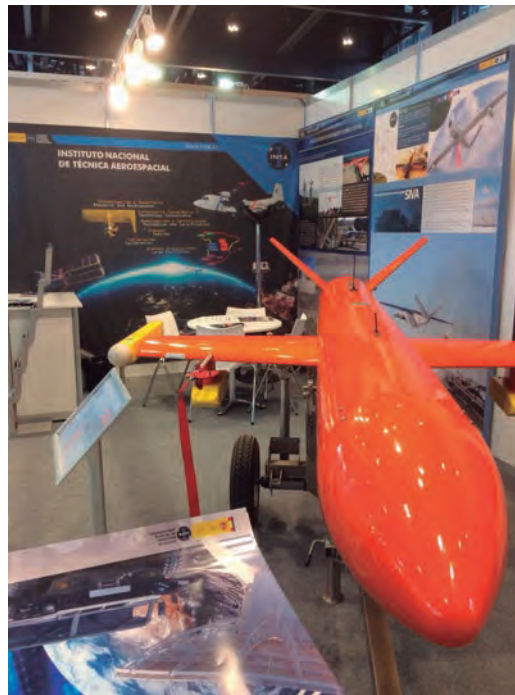
León. El INTA mostró sus aviones ligeros de observación (ALO) y el blanco aéreo Diana .

ponen de espacio segregado para poder operar algunos de los drones con los que se adiestran las Fuerzas Armadas. La jornada del 29 de mayo se desarrolló en la base aérea de La Virgen del Camino , en cuyas instalaciones se ubica la Academia Básica del Aire. Allí volaron los nanodrones Black Hornet y Snipe , el mini Tucán , el Mantis y el sistema antidrón RF100/RF500 . Al día siguiente la base Conde de Gazola en el Ferral del Bernesga fue el escenario elegido para las exhibiciones aéreas del Atlantic , el Fullmar , y Shepherd y la terrestre del prototipo del vehículo blindado todoterreno español conducido por control remoto URO Vamtac , un proyecto del INTA y la Universidad Politécnica de Madrid.